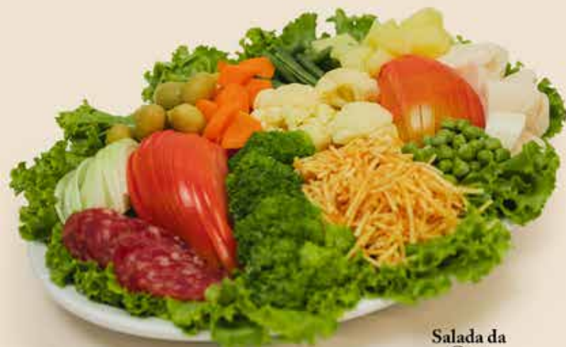
Salada da Casa