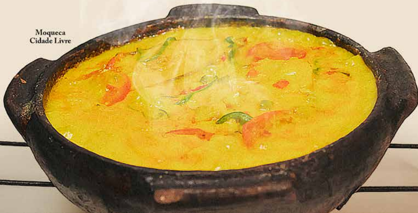
Moqueca Cidade Livre